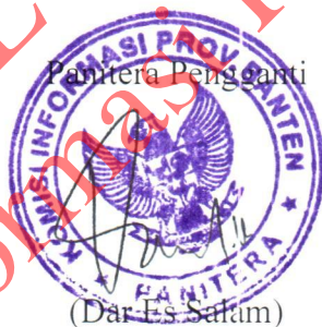
Panitera Pengganti (Dar Es Salam)

SALINAN Komisi Informasi Provinsi Banten