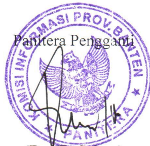
Panitera Pengganti (Dar Es Salam)